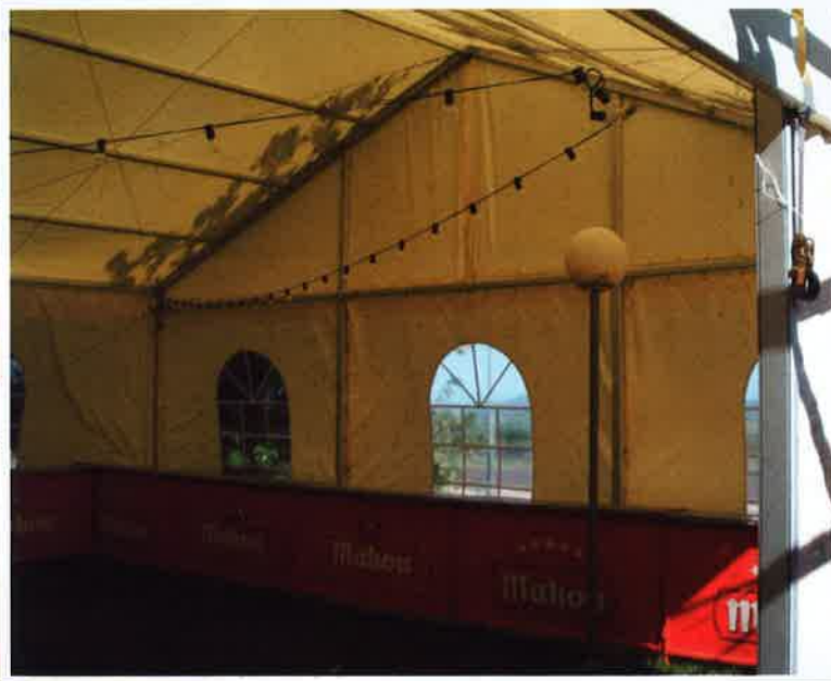
Los tejidos de Sedó responden a las necesidades del cliente en arquitectura textil.

Las líneas de fabricación de tejidos para arquitectura textil de Sedó reciben el nombre de Sed Up, y están disponibles en una amplia variedad de colores, anchos y gramajes. Se pueden encontrar artículos ignífugos, lacados, opacos y con una carta de más de 30 colores diferentes, todo ello para poder realizar cualquier proyecto con las mejores garantías y resultados. •