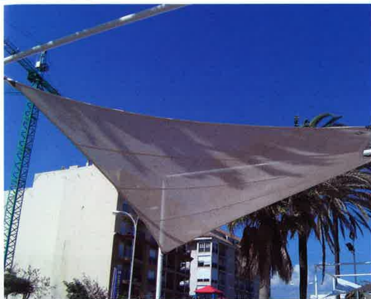
Sed Up son los tejidos de Sedó para arquitectura textil.

Sedó fabrica los tejidos técnicos que hacen que esta arquitectura tenga unas características especiales, que sea resistente a la intemperie, a los agentes externos, que conserve su color y textura con el paso de los años, y, sobre todo, que perdure en el tiempo. Su equipo de especialistas investiga e innova continuamente con nuevos componentes, para estar siempre en lo más alto del diseño y del servicio, buscando tejidos y características que se adapten a las necesidades que transmita el cliente.